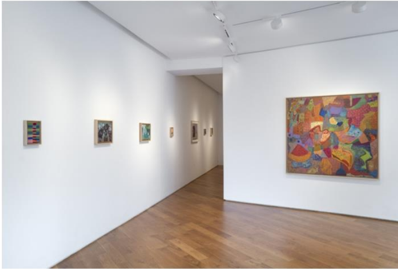
Vue de l'exposition Fiere Ghebreyesus : Map / Quilt, galerie Lelong & Co, Matignon, Paris

Car Ghebreyesus, avant même de se former plus avant dans la pratique de l'art, évoquait l'acte de peindre comme répondant à un besoin d'une intensité immense, exorcisant dans son expression les expériences traumatiques ayant émaillé sa jeunesse 1 . Cette résolution de la violence dans la peinture est au cœur du paradoxe Ghebreyesus, figurant derrière le calme et la solitude apparents de ses images une terrible appréhension de l'effondrement, la persistance de sa conscience d'un écroulement possible.