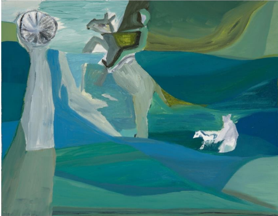
Ficare Ghebreyesus, Horse and Rider, 2011 Huile sur toile — 28 × 35,5 cm © The Estate of Ficare Ghebreyesus / Courtesy Galerie Lelong & Co.